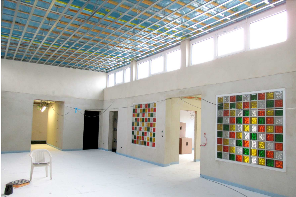
Der der große Spielflur im Inneren des Neubaus ist ein Highlight der neuen Kita Großkorbetha.