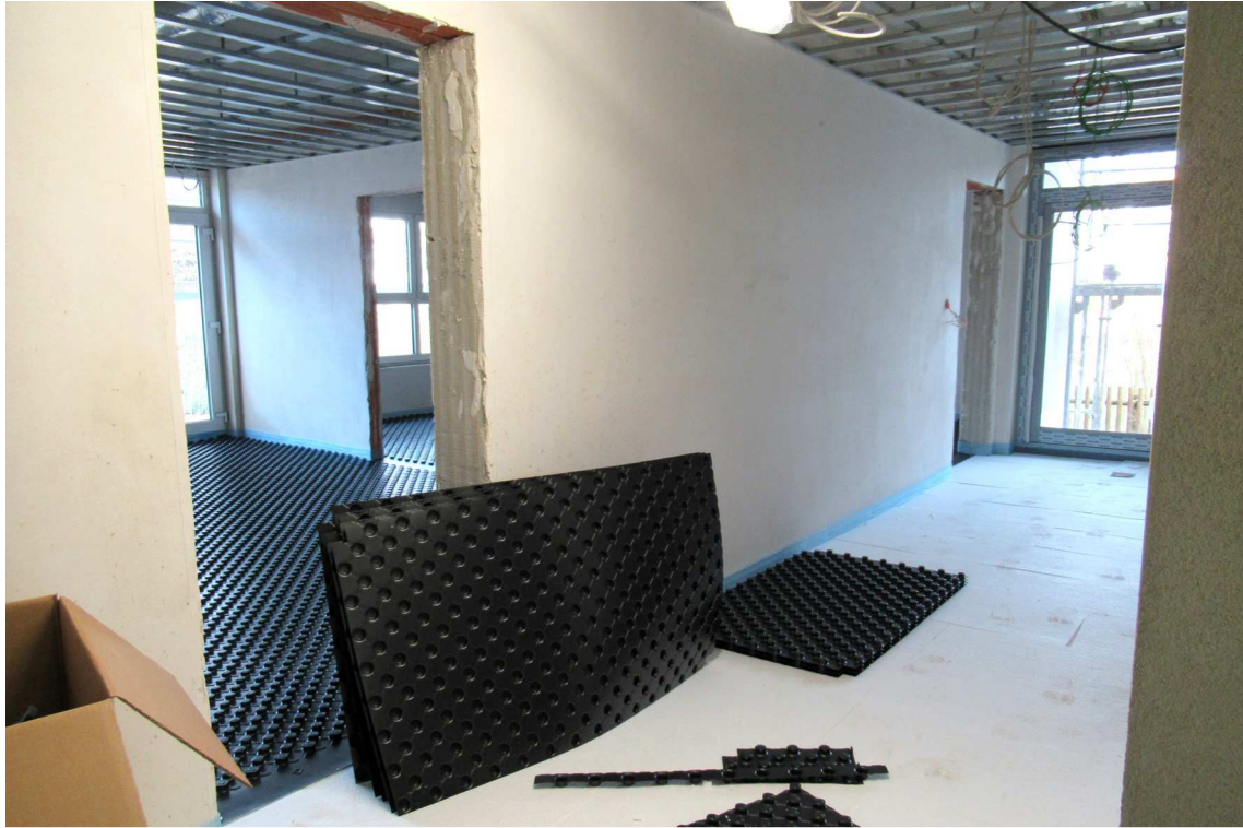
Insgesamt sechs Gruppenräume und zwei Ruheräume bieten viel Platz für die Krippen- und Kindergartenkinder.