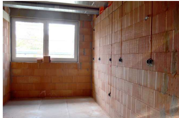
Rohbau des Kita-Neubaus.