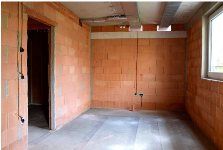
Künftiger Besprechungsraum für die Erzieher.