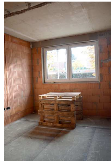
Raum neben dem Haupteingang.