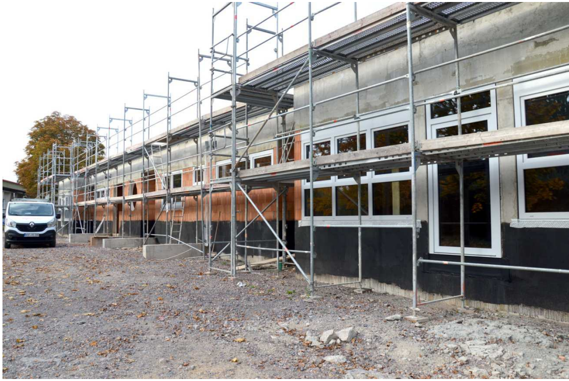
Der Rohbau des Kita-Neubaus in Großkorbetha steht.