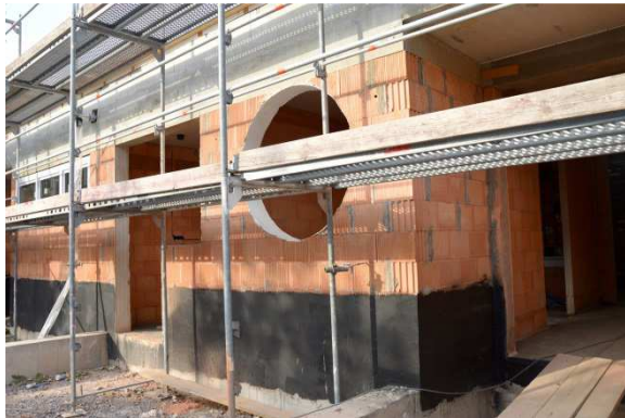
Rundfenster im Eingangsbereich des Neubaus