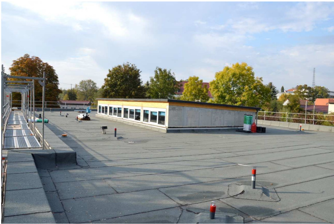
Das Betonflachdach ist abgedichtet. Später werden hier noch Sonnenkollektoren aufgebaut, die die Kitakinder mit Warmwasser und Strom versorgen.