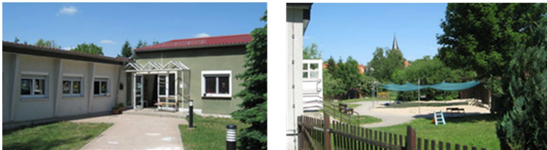
Bestandsgebäude und Außengelände Kita Haus Sonnenschein

Die Stadt Weißenfels ist Träger der Kindertagesstätte Haus Sonnenschein im Ortsteil Großkorbetha. In der Einrichtung werden über 70 Kinder im Krippen- und Kindergartenalter betreut. Bei dem bisherigen Gebäude handelt es sich um einen Flachbau in Barackenform aus dem Jahr 1982. Durch die Aufnahme der Kita in das Förderprogramm Stark III/ELER kann ein moderner und funktionaler Ersatzneubau errichtet werden, welcher aktuelle Energiestandards erfüllt.