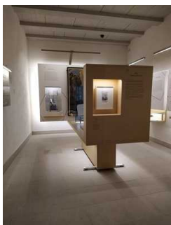
Rundweg Ausstellung Erdgeschoss