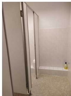
Zugang Öffentliches WC Damen