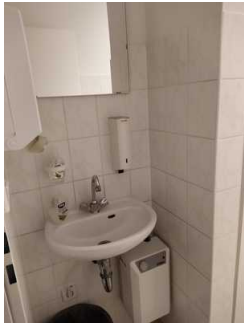
WC Damen Waschbecken