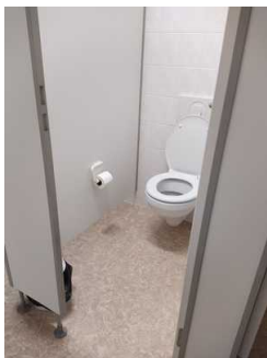
Öffentliches WC Herren