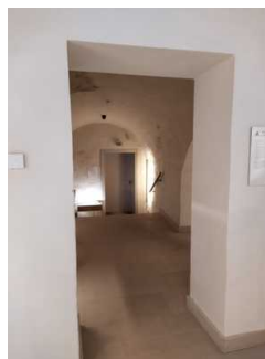
Rundweg Ausstellung Erdgeschoss