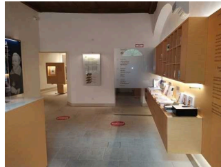
Blick in Eingangsbereich mit Kasse