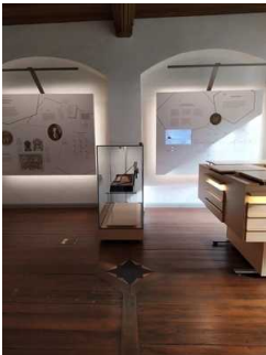
Rundweg 1. Obergeschoss