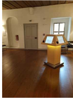
Rundweg 1. Obergeschoss