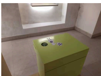
Hilfsmittel – Soundstation