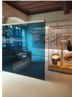
Rundweg Ausstellung Erdgeschoss