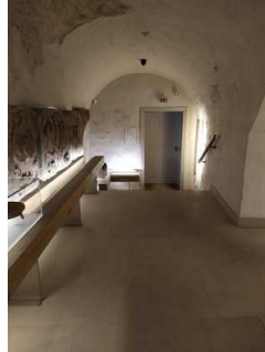
Rundweg Ausstellung Erdgeschoss