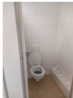
Öffentliches WC Herren