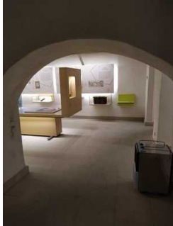
Durchgangshöhe 1,85 m