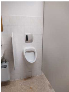
Urinal Öffentliches WC Herren