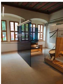
Rundweg Ausstellung Erdgeschoss