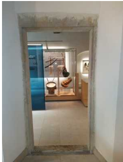
Start Rundweg Ausstellung Erdgeschoss