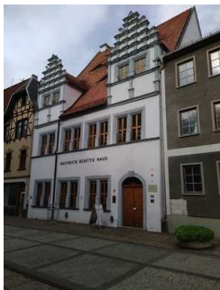
Heinrich-Schütz- Haus Weißenfels