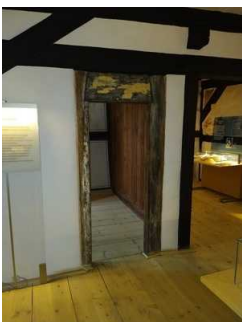
Durchgangshöhe 1,73 m