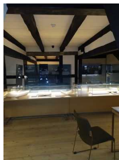
Rundweg 2. Obergeschoss