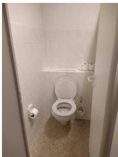
Öffentliches WC Damen