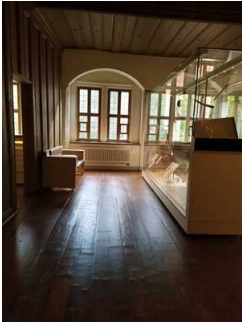
Rundweg 1. Obergeschoss