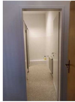
Zugang Öffentliches WC Damen