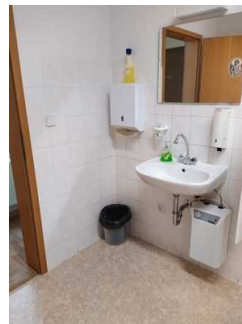
Waschbecken Öffentliches WC Herren